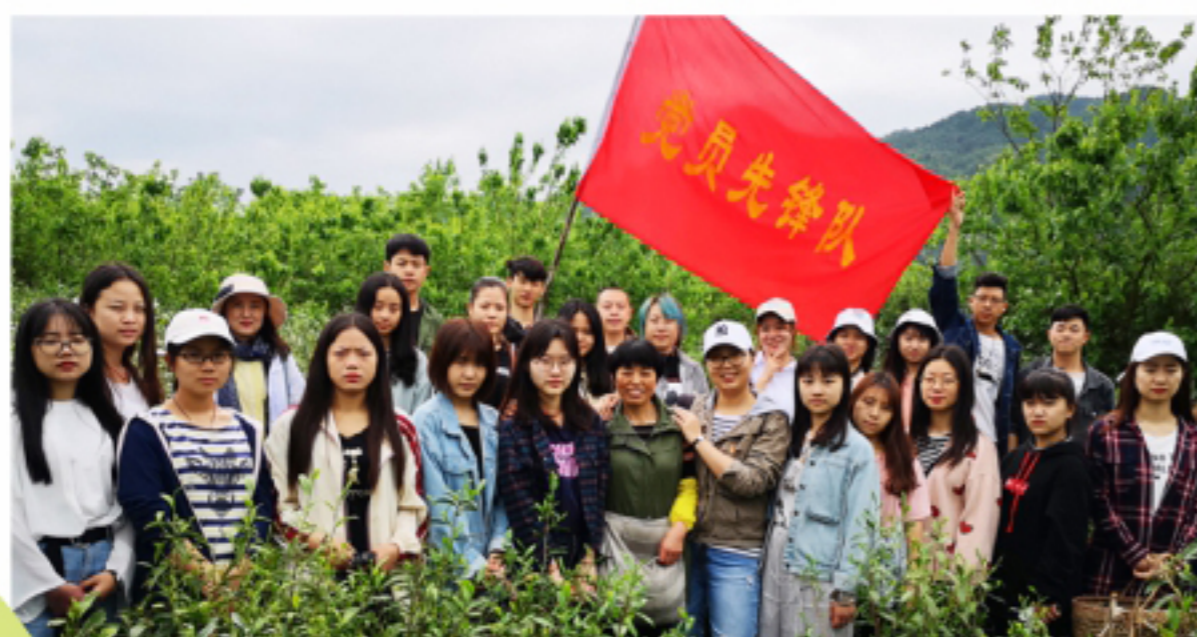
助茶农、传爱心 临时党小组活动

主要课程: 计算机辅助产品设计、机械制图、产品设计表现、产品设计程序与方法、人机工程学、概念设计、产品模型与制作工艺、产品改良设计、竹产品设计等。