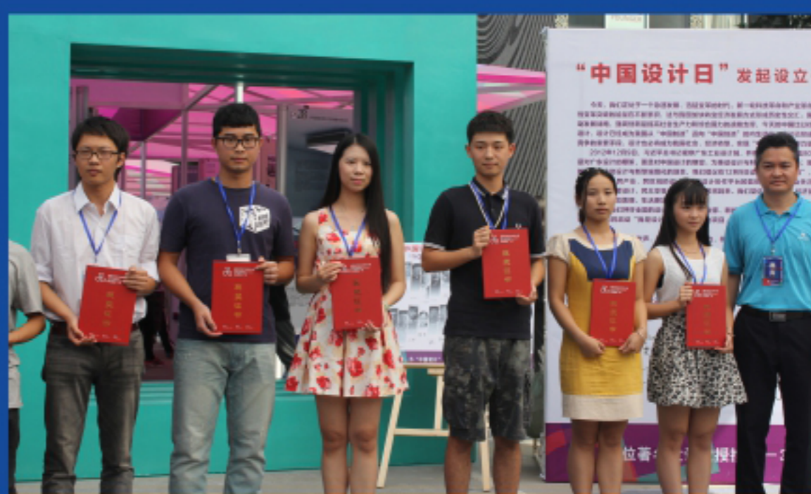
艺院学子在全国大学生工业设计大赛中 获全国三等奖（右四）