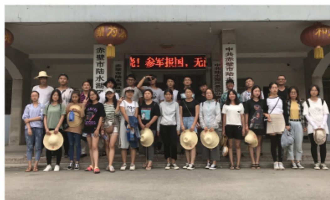
师生参加暑期社会实践活动